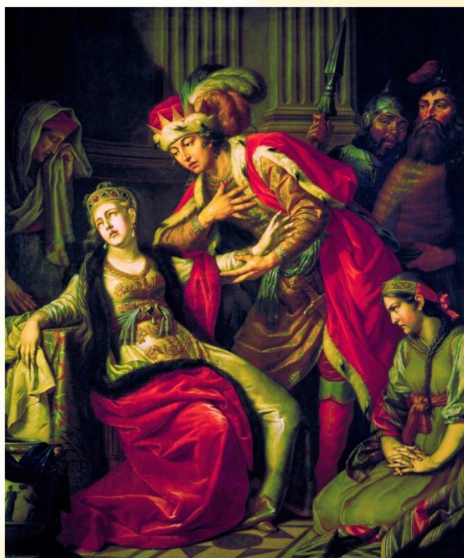
Картина «Владимир и Рогнеда» художника АЛьсенко (1770)

Трагические события, связанные с дочерью полоцкого князя Рогволода, начались со сватовства к ней двух братьев: Ярополка и Владимира. Первый был князем киевским, второй – новгородским. Рогнеда выбрала Ярополка, чем сильно разгневала Владимира. Он напал на Пблцк, сжег город, убил Рогволода и всю его семью, а Рогнеду взял в жены насильно и повез в Киев.