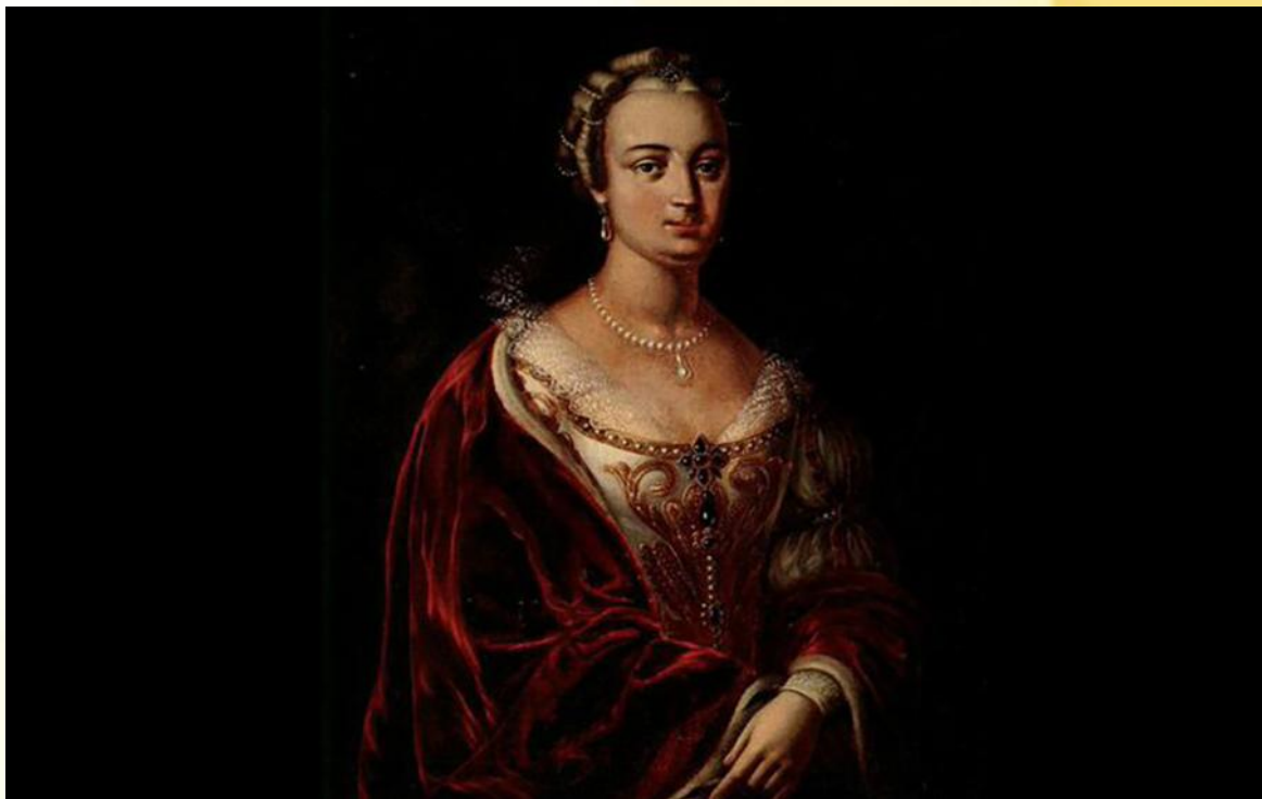
Портрет Франциски Урсулы Радзивилл неизвестного автора

Первая женщина-писательница Беларуси, создательница первого классического театра на нашей земле и последняя представительница знаменитого рода Вишневецких, Франциска Урсула Радзивилл родилась 13 февраля 1705 года.