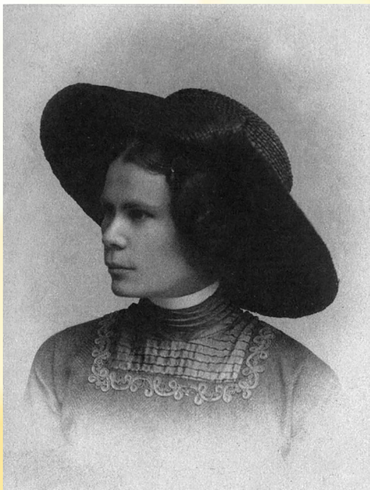
Фотопортрет Алоизы Пашкевич (1912)

Была одним из руководителей Белорусской социалистической громады. По воспоминаниям современников, Алоиза считалась хорошим оратором.