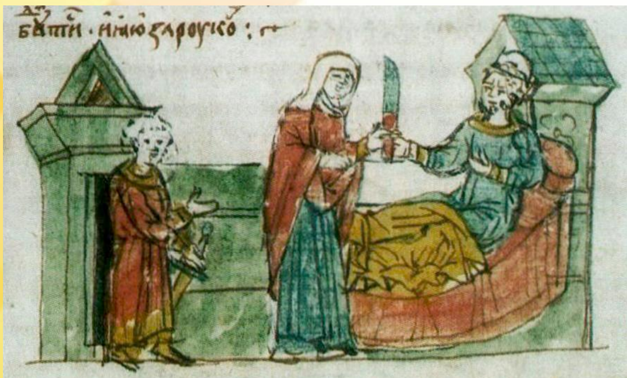
Покущение Рогнеды на Владимира. Миниатюра Радзивилловской летописи, конец XV века

Летописцы зафиксировали, что для полоцкой княжны и ее сына по приказу Владимира построили город Ивяслав. Теперь это Заславль.