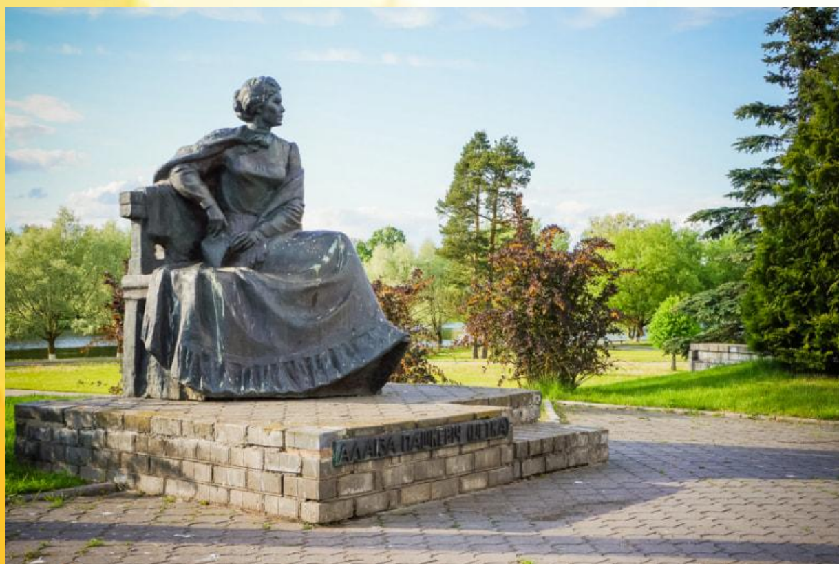
Памятник Алоизе Пашкевич в Щучине

Похоронена поэтесса в деревне Старый Двор Щучинского района.