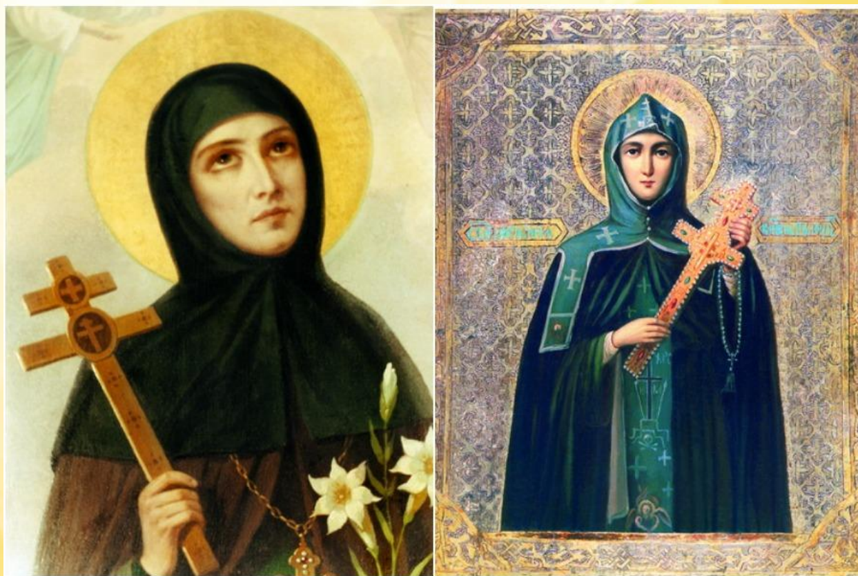
Иконы прегробоной Евфросинии Полоцкой

До пострига носила имя Предслава. Узнав, что родители собираются отдать ее замуж, в 12-летнем возрасте убежала из дома к своей тете – настоятельнице монастыря. Приняла монашество под именем Евфросинии, что в переводе с греческого означает «радость». Поселившись в келье полоцкого Софийского собора, вела летопись и собирала библиотеку, которая со временем стала настоящим духовным сокровищем восточнославянских земель.